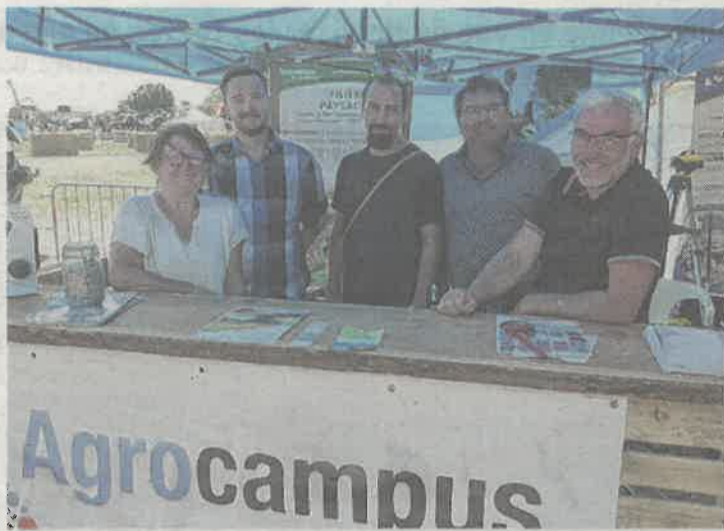
Le BTS ACSE sera le pari de cette nouvelle année scolaire pour l'équipe de l'Agrocampus de Saintonge.